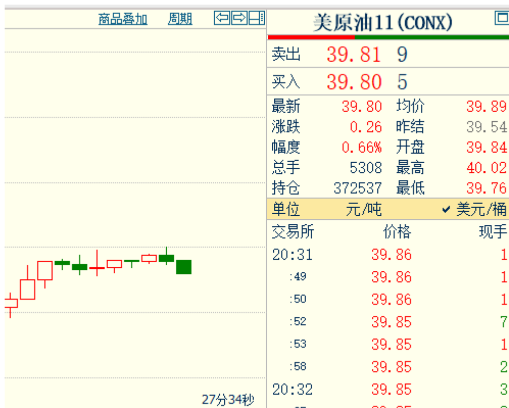
图示：WTI10 9月22日国内2点半至8点半走势图（半小时线）