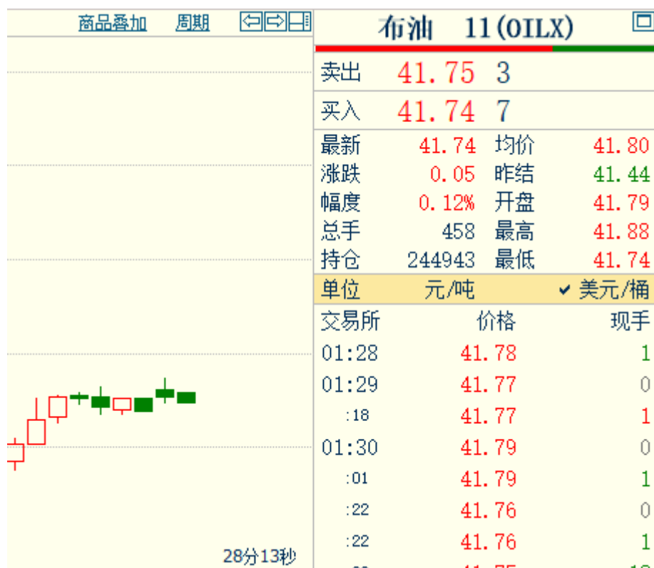
图示：Brent11 9月22日国内2点半至8点半走势图（半小时线）