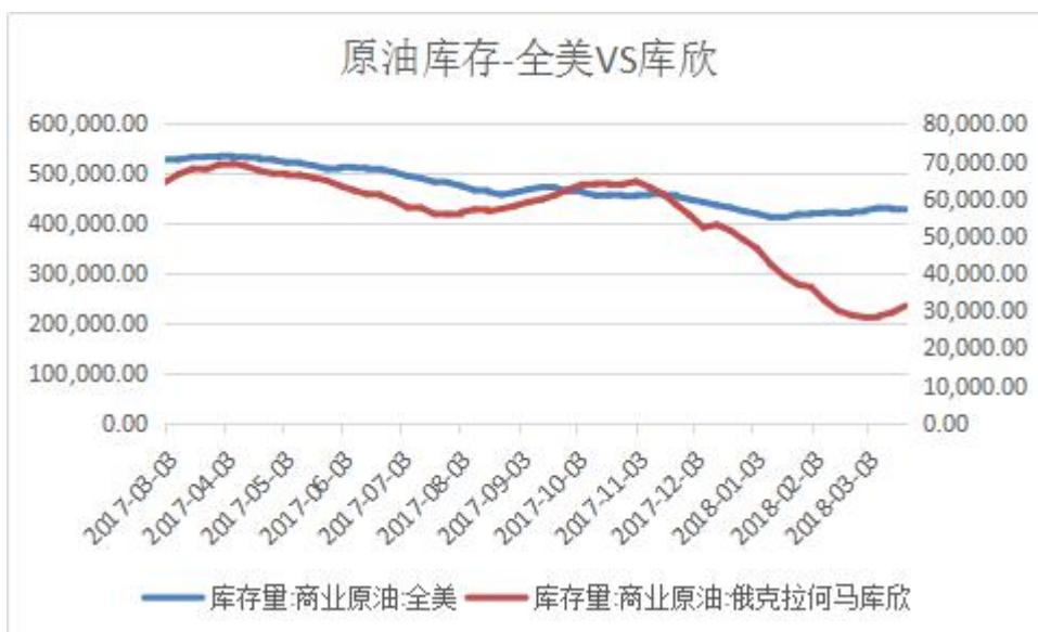
图 6：美国商业原油环比同比情况